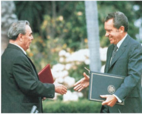
Leonid Breznev, secretario general del Partido Comunista de la URSS y Richard Nixon, presidente de los EE UU, en Nueva York en junio de 1973.

política anticomunista, pero fue sobre todo John F. Kennedy (1961-1963) quien propuso un giro en la política exterior americana y en las relaciones con la URSS.