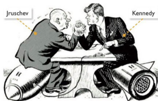
DOC.1 Caricatura británica sobre la Guerra Fría, 1962.

La rivalidad entre los bloques se manifestó en la llamada Guerra Fría, que es una tensión permanente entre EEUU y URSS, que se caracterizó por una actitud beligerante y el constante rearme (carrera de armamentos). El enfrentamiento entre los dos países nunca fue directo, sino a través de conflictos periféricos, en los que ambos bloques se enfrentaban de manera indirecta, a través de dar apoyo político, económico y militar a sus aliados. Hasta 1950, el escenario del enfrentamiento fue Europa pero, a partir de esa fecha se trasladó a otras zonas del mundo. El proceso de descolonización fue un elemento de rivalidad importante, dado que ambas estaban plenamente resueltas a impedir que los nuevos países independientes se alinearan con el bloque rival.