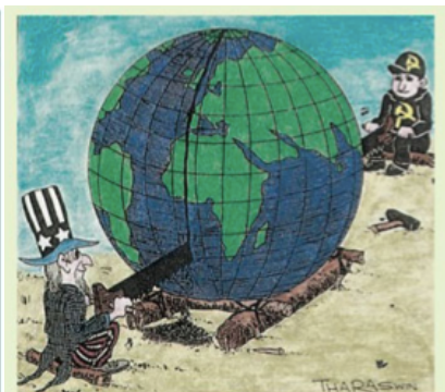
DOC.1 Caricatura sobre la partición del mundo en los bloques de influencia.

La Segunda Guerra Mundial había conducido hacia una alianza circunstancial entre las potencias occidentales (Reino Unido y EEUU) y la potencia de Europa oriental (URSS). Una vez derrotado el enemigo común, Alemania y Japón, reaparecieron las diferencias ideológicas,