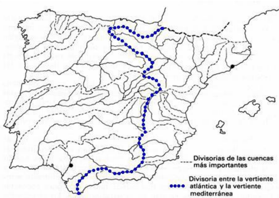
Principales cuencas hidrográficas de la Península