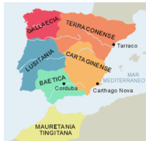
División de Diocleciano (298 dC).