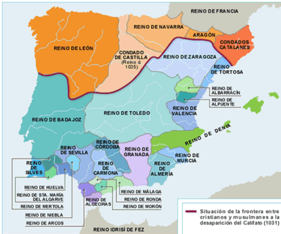
Los Reinos de Taifas

Durante esta etapa alternan etapas de unificación territorial, como el califato de Córdoba, y de dispersión, como Reinos de Taifas. Con la invasión se inicia una nueva etapa histórica, política... Solo algunos núcleos y valles del norte quedan libres del control islámico, pero al no tener relación entre sí fueron incapaces de ordenar política o administrativamente el conjunto de sus territorios.