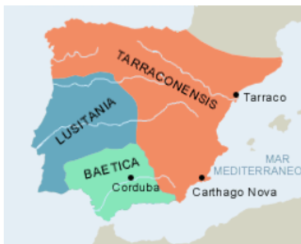
División de Augusto (27 aC).

Con los visigodos se mantuvo la organización administrativa, aunque progresivamente se fue generando otra nueva. El reino, con capital en Toledo, integra bajo su autoridad a todos los pueblos hispano-romanos y godos.